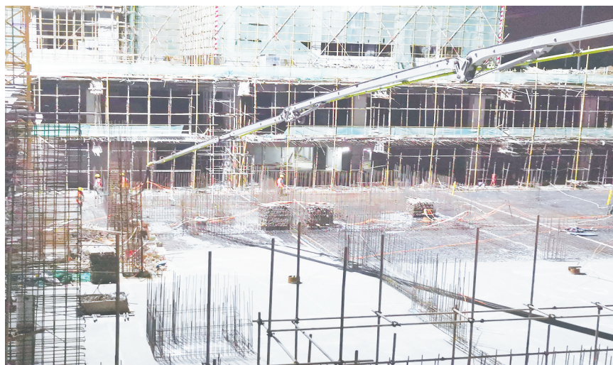
三标段运营中心筏板基础夜间浇筑,主楼将于6月8日封顶

如今,这里机声隆隆,热浪袭人。近400米的车轮生产线几乎看不到工作人员。所有坯料转运、上下料全部由机械手和转运小车实现,无需人工干预, (下转第三版)